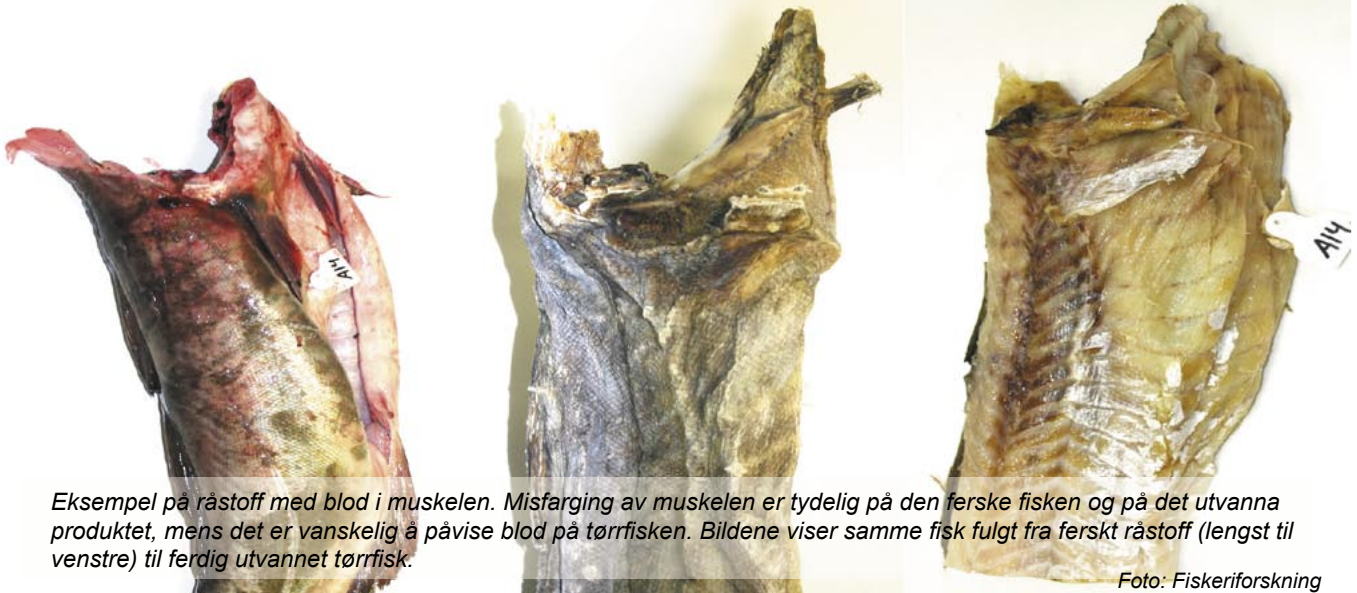
Eksempel på råstoff med blod i muskelen. Misfarging av muskelen er tydelig på den ferske fisken og på det utvanna produktet, mens det er vanskelig å påvise blod på tørrfisken. Bildene viser samme fisk fulgt fra ferskt råstoff (lengst til venstre) til ferdig utvannet tørrfisk.